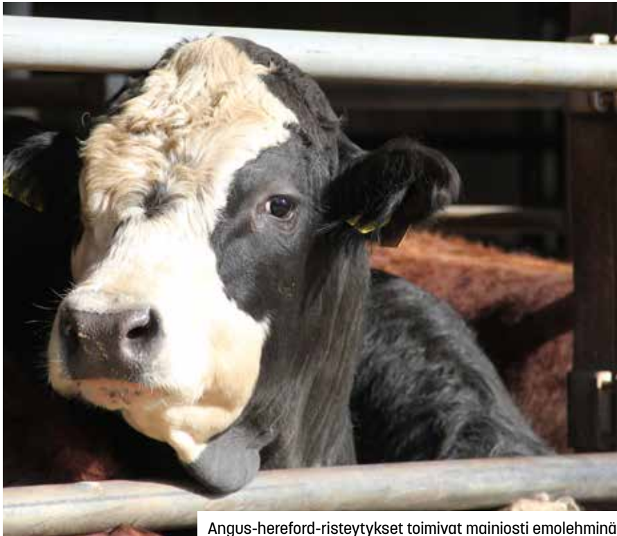
Angus-hereford-risteytykset toimivat mainiosti emolehminä.

Risteytys on helppo, käytännöllinen ja kustannustehokas tapa lisätä eläinaineksen tuotannon-tasoa. Risteytysvaikutus antaa perinnöllisen lisäyksen jälkeläisten tuotannolliseen tasoon verrattuna vanhempaispolveen.